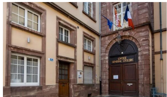
Lycée Leclerc, Saverne